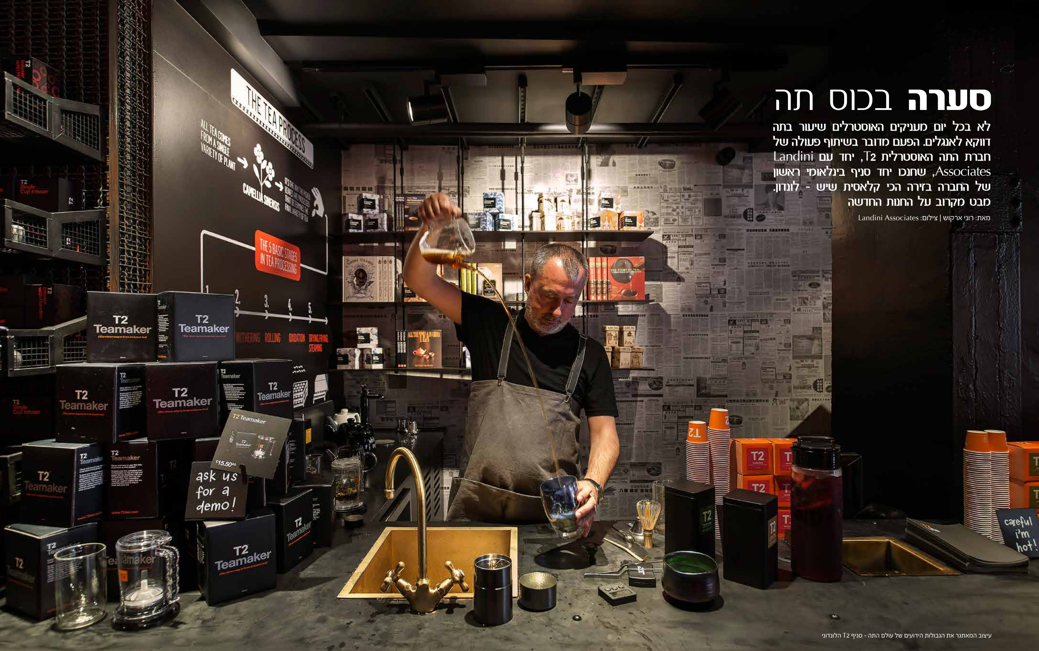
עיצוב המאתגר את הגבולות הידועים של עולם התה - סניף T2 הלונדוני

מאת: רוני ארקוש