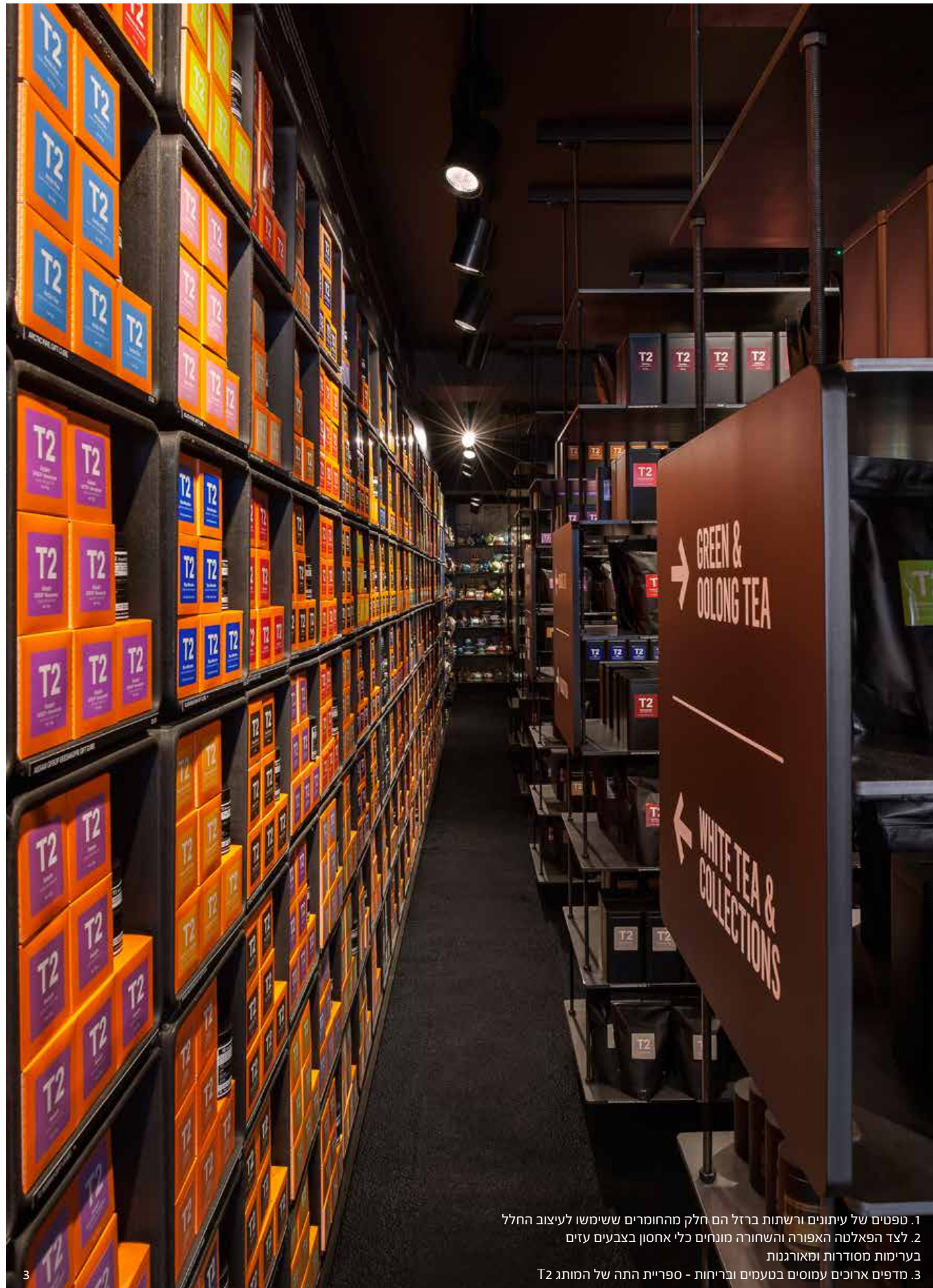
1. טפטים של עיתונים ורשתות ברזל הם חלק מהחומרים ששימשו לעיצוב החלל 2. לצד הפאלטה האפורה והשחורה מונחים כלי אחסון בצבעים עזים בערימות מסודרות ומאורגנות 3. מדפים ארוכים עמוסים בטעמים ובריחות - ספריית התה של המותג T2

בחנות מביא אל לונדון קצת מהאווירה המלבורנית ומדגים מגמה חדשה בעיצוב חנויות הרשת של T2. שיתוף הפעולה של החברה עם Landini Associates, נוסף על שינויים עיצוביים אחרים כגון העיצוב המחודש של משרדי החברה במלבורן והשקת קונספט של בר חליטות הצף כחנות פופ-אפ במיקומים משתנים, יוצר אווירה חדשנית ומרגשת בעולם התה עתיק היומין. היעד הבא שעתיד לקחת חלק במהפכה העיצובית הזו הוא ניו יורק, שם עתיד להיפתח סניף נוסף של חברת T2. אין ספק כי הזירה האנגלית שמורגלת לבתי תה יוקרתיים ואלגנטיים תיהנה גם מהאווירה הצעירה והחדשנית שמביאים איתם ב-T2, וייתכן בהחלט כי זוהי רק הסגנונית הראשונה שמבשרת את באוה של עידן התה החדש.