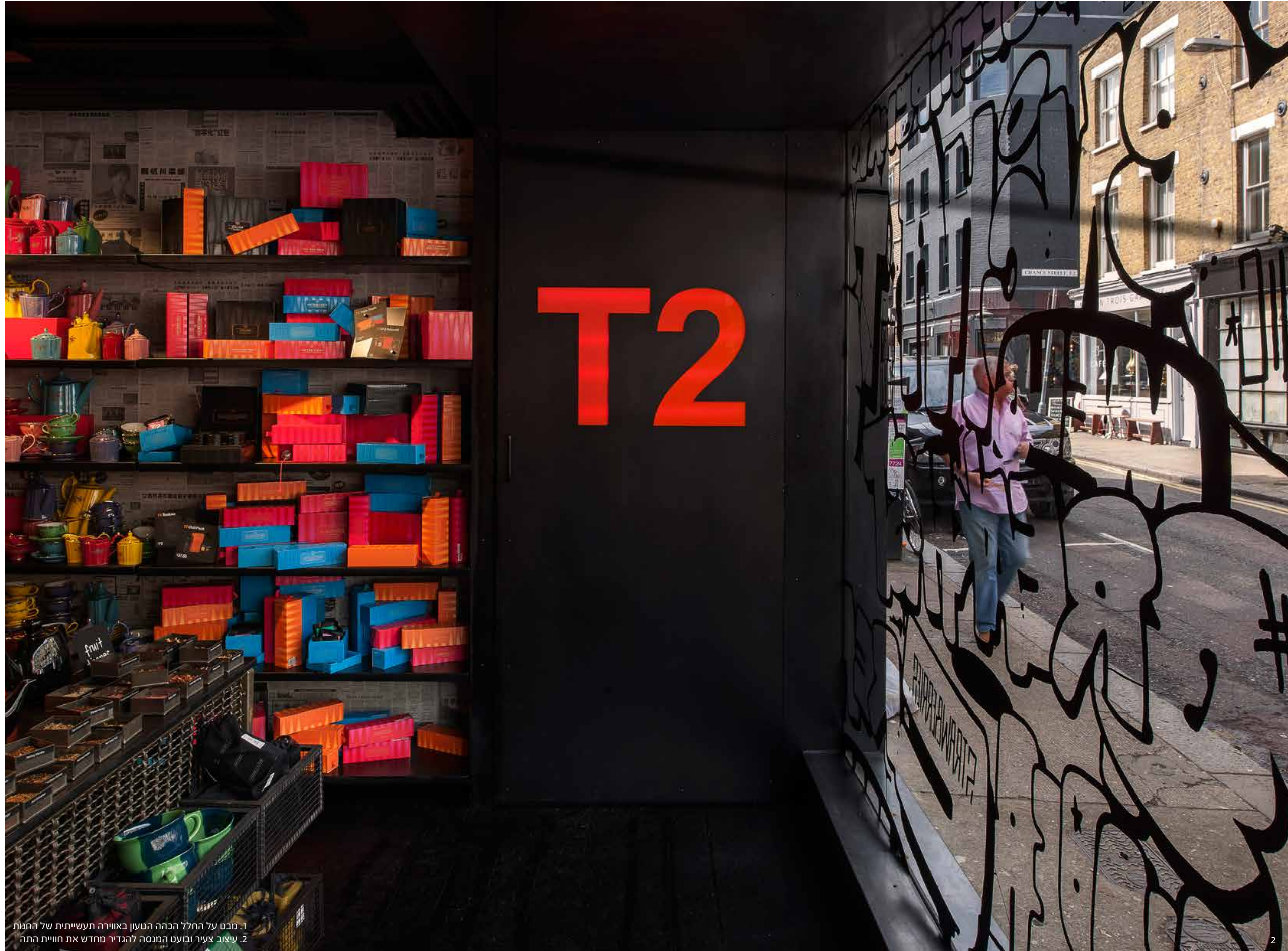
1. מבט על החלל הכהה הטעון באווירה תעשייתית של החנות 2. עיצוב צעיר ובוועט המנסה להגדיר מחדש את חוויית התה

חלל החנות עוצב כמעין ספריית תה שלמה ומגוונת עם שורות על גבי שורות שמכילות כ-250 סוגים שונים של תה. החלל עצמו כמעט עירום וחף מדקורציה, במטרה לפנות כמה שיותר מקום לנוכחות ולעוצמה של תערובות התה